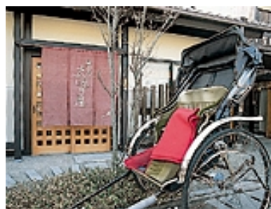
人力車に乗って京都嵯峨野を散策