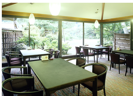
嵐亭のレストランで昼食